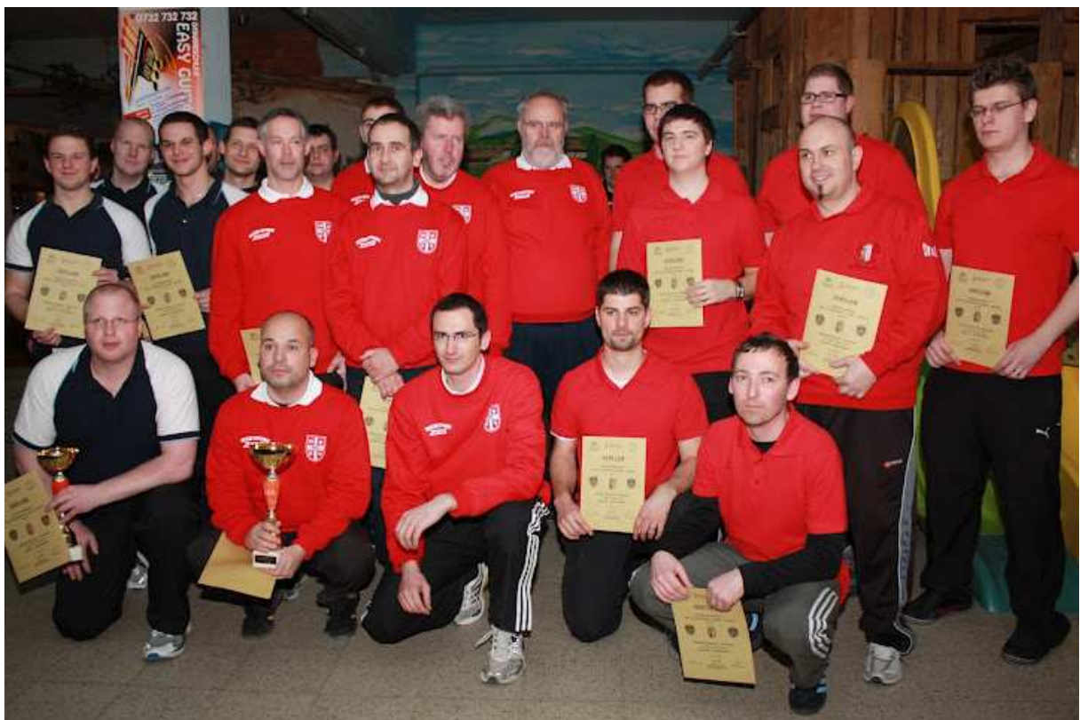
Die erfolgreichen Mannschaften aus Niederösterreich, Wien und Oberösterreich