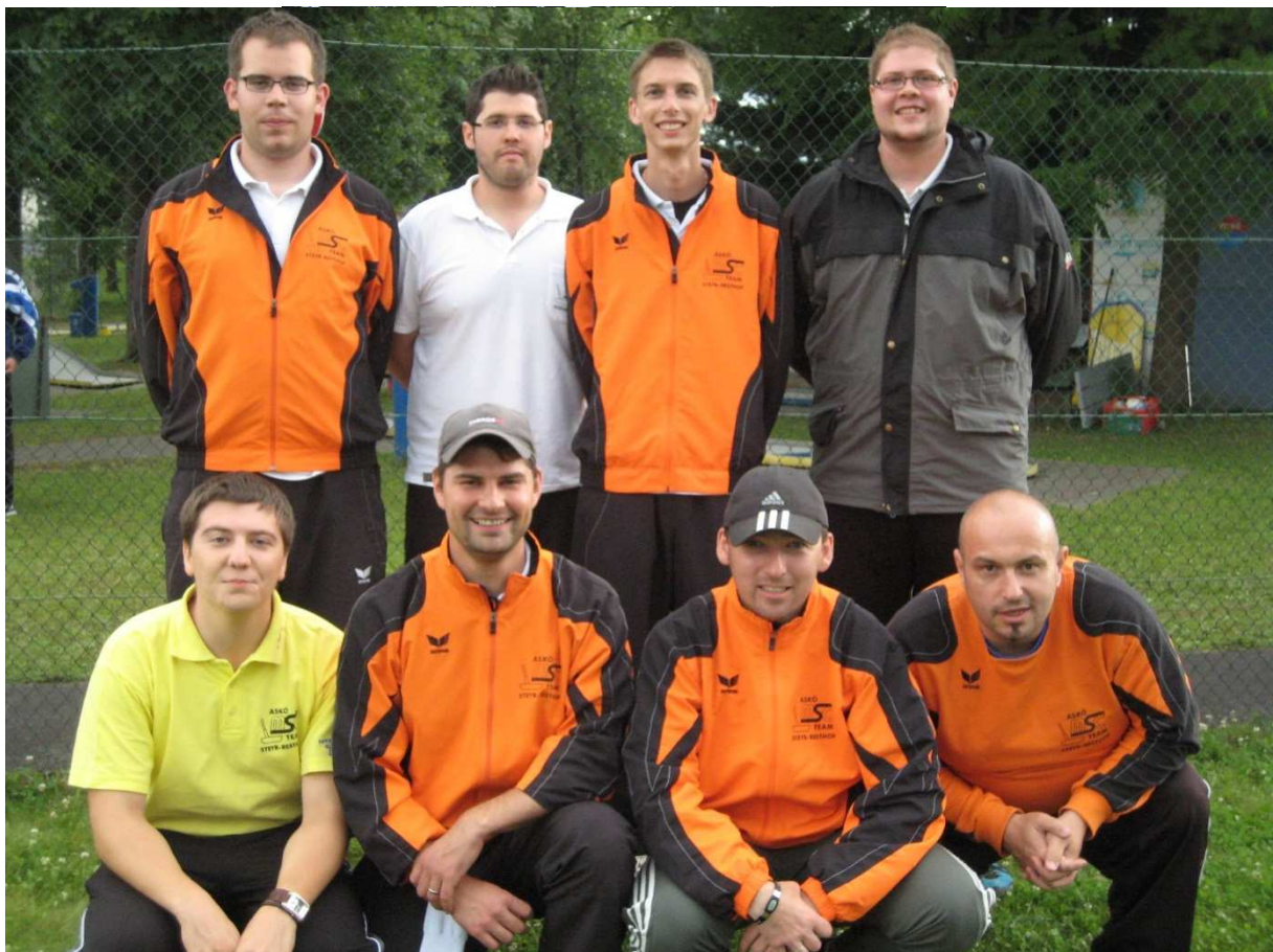
ASKÖ MSC Team Steyr-Resthof

Die zweite Runde findet 2013 in der Eferdinger Miniaturgolfhalle statt.