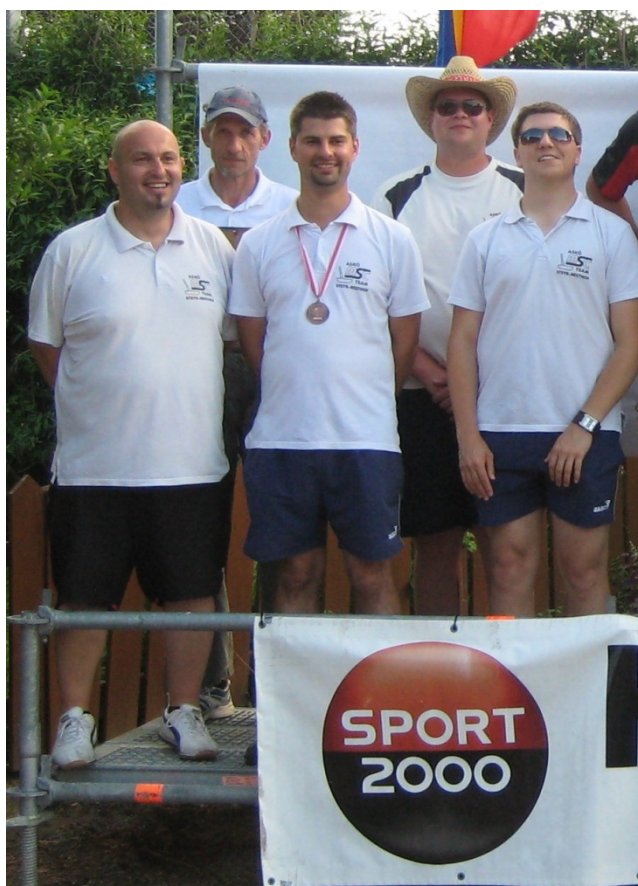
TEAM ASKÖ MSC STEYR

Zuversichtlich blickt man nun auf die dritte und vierte Bundesligarunde, die kommende Woche in Innsbruck stattfindet.