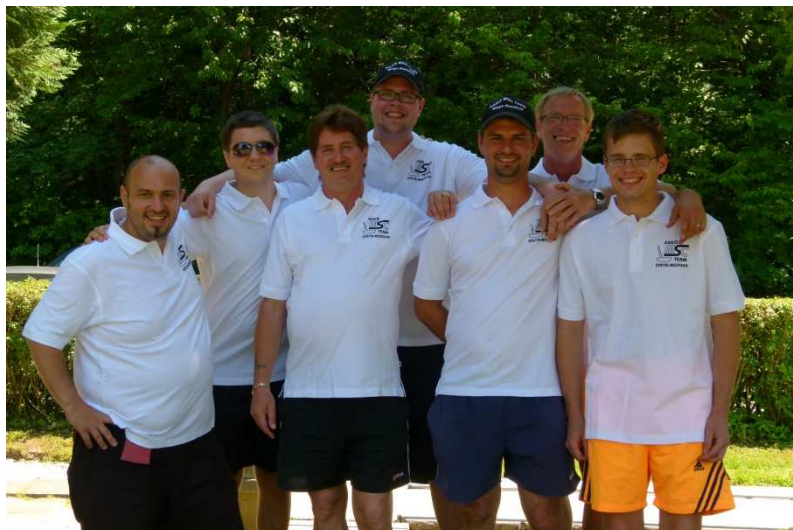
Team ASKÖ MSC STEYR

Somit gingen die prestigeträchtigsten Kategorien dieser Landesmeisterschaft alle samt an den ASKÖ MSC Steyr.